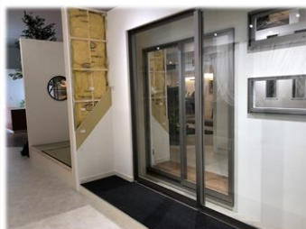
本社に隣接する研修センター