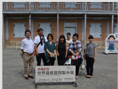
全国から集まった窓装飾プランナー