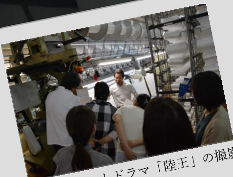
昨年の大ヒットドラマ「陸王」の撮影現場にもなった工場です。