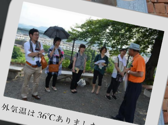
外気温は 36℃ありました

明治維新の直前 群馬で作られた生糸は世界でも高水準の出来栄でした。地方から多くの女性が富岡製糸場で技術を学び、郷へ伝承していきました。