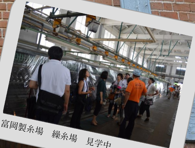
富岡製糸場 繰糸場 見学中

2018年の7月は「危険な暑さ」と呼ばれ、見学会の前日に近隣の熊谷市で史上最高気温 41.2℃を記録した。西日本豪雨の影響で多少のキャンセルがあり最終8名が参加して行われました。