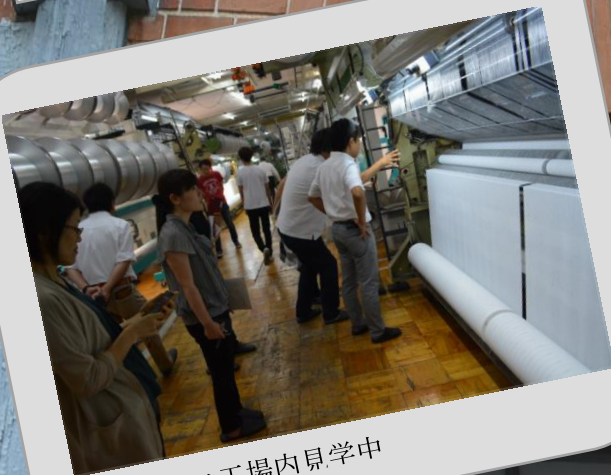
黒沢レース工場内見学中

明治維新の直前 群馬で作られた生糸は世界でも高水準の出来栄でした。地方から多くの女性が富岡製糸場で技術を学び、郷へ伝承していきました。