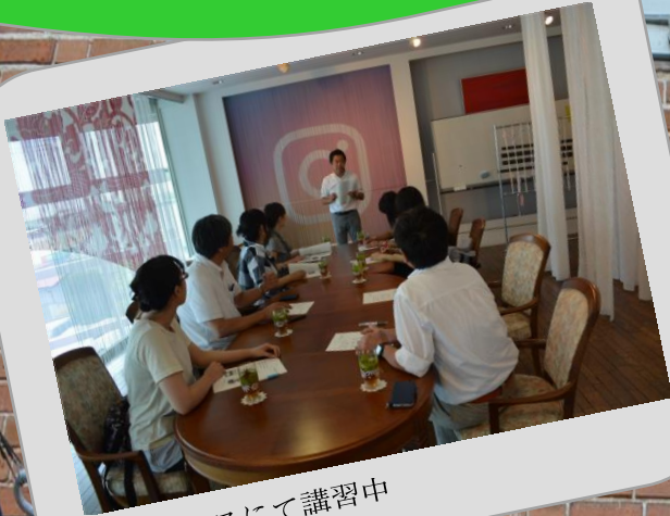
黒沢レースにて講習中